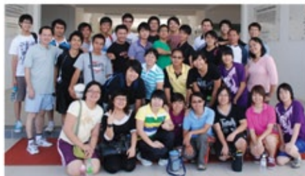
Gambar berkumpul peserta di Sekolah Visi Anglikan, Tawau.

Diosis telah menjalankan Sekolah Pastor Muda-mudi selama 16 tahun yang lalu. Pada mulanya, ia dikenali sebagai Intrigue (Latihan intensif dalam Injil kepada Para penginjil Bandar) dan kemudiannya diubah kepada Sekolah Pastor Muda-