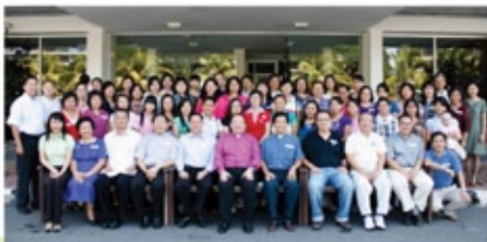
Gambar berkumpulan peserta di luar Wisma Anglikan.

"Anda seharusnya kembali dengan sebuah lagu di dalam hati anda dan sebuah tarian untuk kaki anda!" Dengan ini, Bishop mengakhiri ucapannya kepada 50 orang ahli jawatan-kuasa tadika dan taska, pengetua-pengetua dan guru-guru dari seluruh diosis. Ramai chaplain (paderi) yang turut hadir.