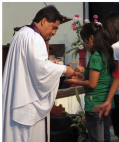
Peserta sedang menerima Perjamuan Kudus.