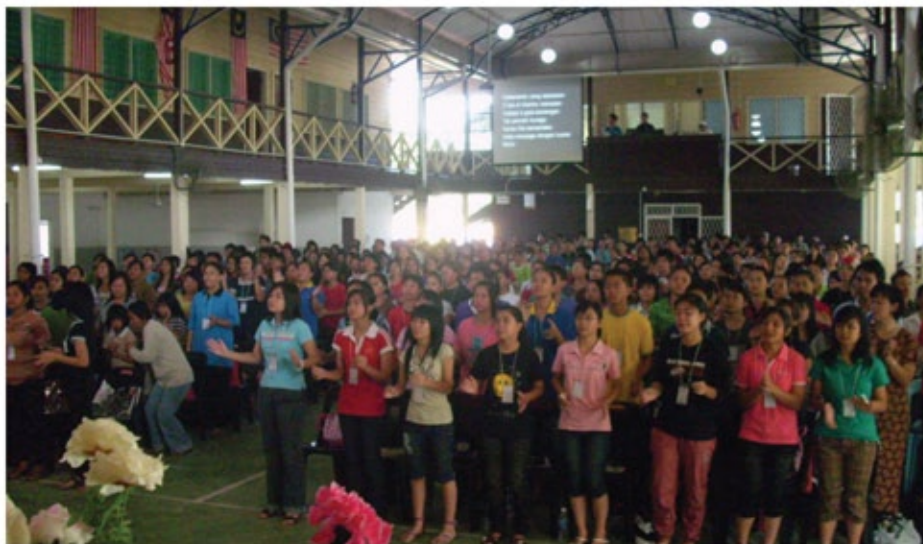
Sebelah Atas Kanan: Sesi Pujian dan Penyembahan di Lembah Berkat.