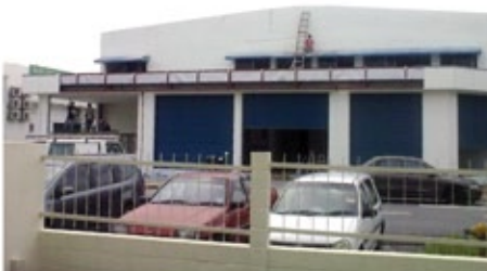
Permandangan dari luar.

Akademi Faith Faith Christian Centre (FCC) di Sunway, Petaling Jaya akan dilancarkan pada September 2010, sementara menunggu kerja pengubahsuaian selesai.