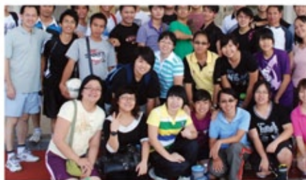
参加者摄于斗湖圣愿学校之合照

青少牧者学校是教区训练课程的其中一部分，特别装备整个教区的青年同工。这个训练特别透过圣经的教导、品格的操练及实际的技巧来帮助他们更清楚自己的呼召、品格及才干。此青少牧者学校是由教区圣召委员会负责，它已经帮助了许多青年同工迈向神学装备及全职牧养服事。