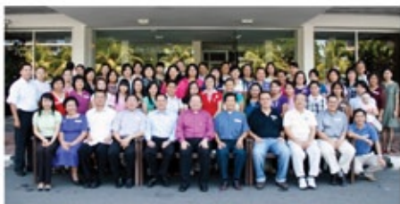
参加者在圣公会大厦外合照

"你应心里欢唱双脚跳舞的返归！"会督以这句话作为他的重点来结束他对来自教区各地超过50位幼稚园和幼儿园的董事会成员、园长和教师的分享。许多校牧（牧者）亦有出席。